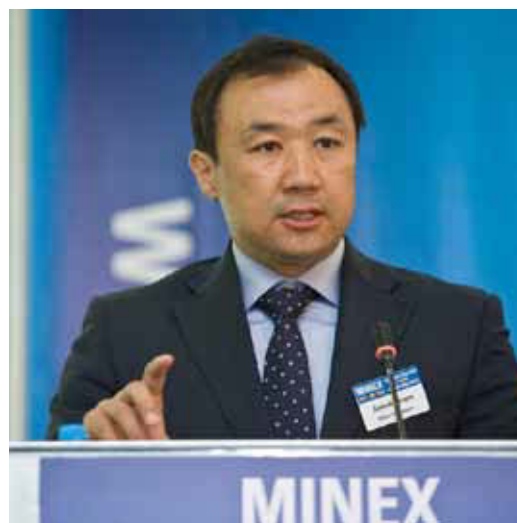
Нурлан Сауранбаев , Вице-министр Индустрии и Новых Технологий Республики Казахстан Выступление на форуме