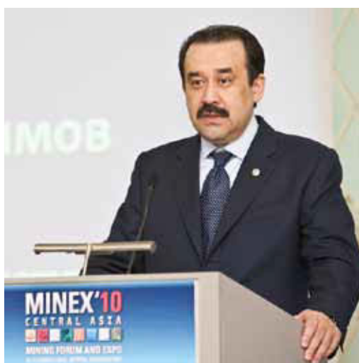
Карим Масимов , Премьер-министр Казахстана Приветственное слово на форуме МАЙНЕКС Центральная Азия 2010

Доклады ключевых спикеров из Казахстана и стран Центральной Азии предоставляют участникам форума уникальные возможности для ознакомления с планируемыми изменениями и государственными инициативами в горно-металлургической отрасли. Региональные сессии и брифинги, организуемые с участием представителей правительственных структур, дают возможность для детального обсуждения вопросов налогообложения, лицензирования, финансирования и инвестиционных возможностей в горной отрасли.