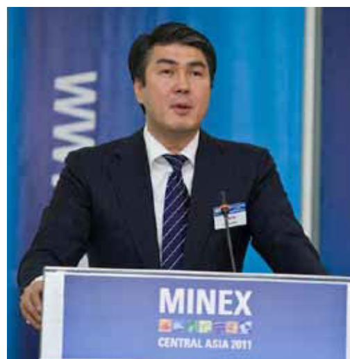
Асет Иссекешев , Вице-премьер, Министр Индустрии и Новых Технологий Казахстана Приветственное слово на форуме МАЙНЕКС Центральная Азия 2011