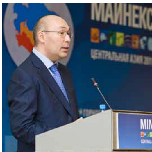
Кайрат Келимбетов , Министр Экономического Развития и Торговли Республики Казахстан. Выступает на ключевых сессиях Форума МАЙНЕКС Центральная Азия 2011.